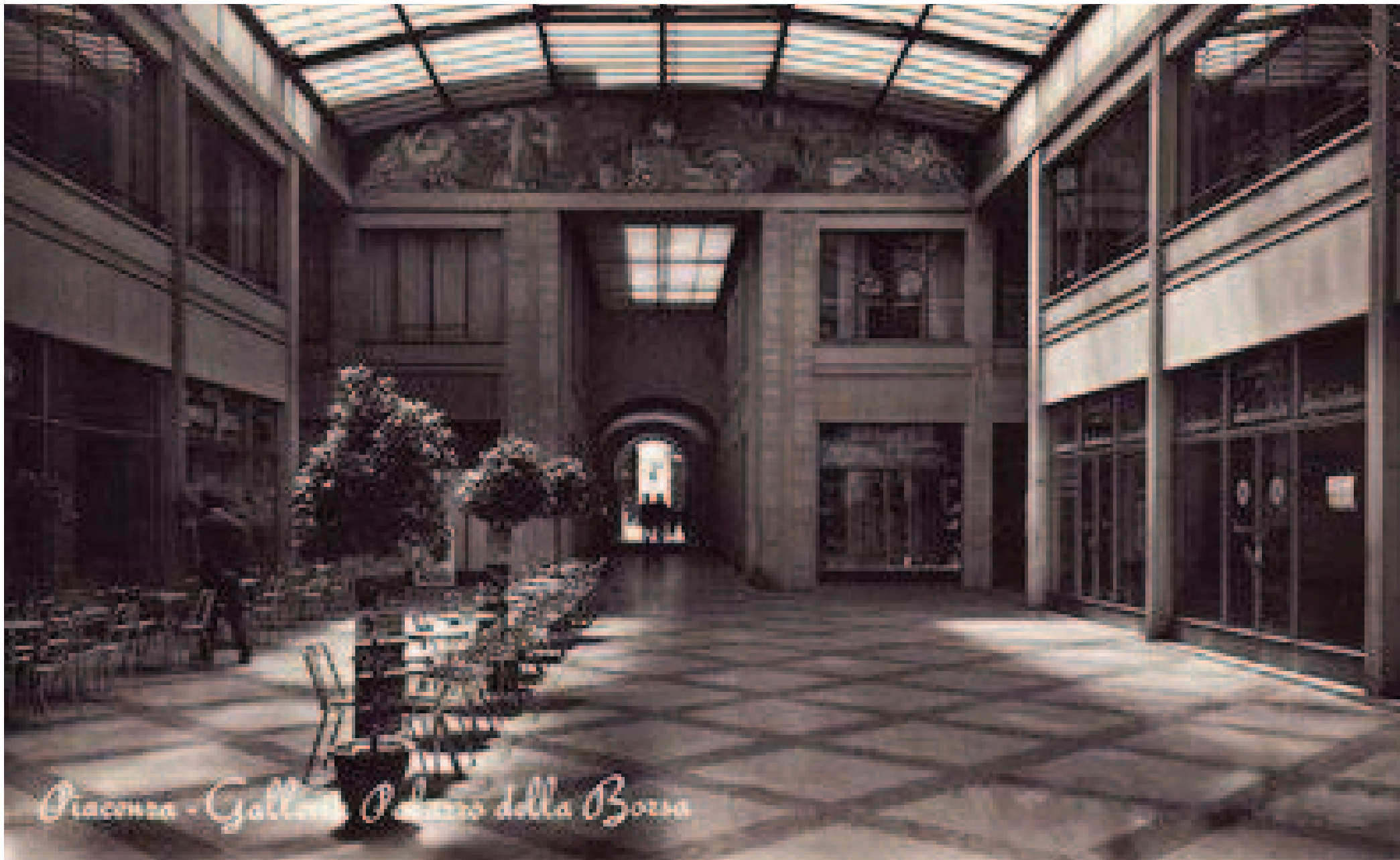
Piacenza - Galleria Palazzo della Borsa