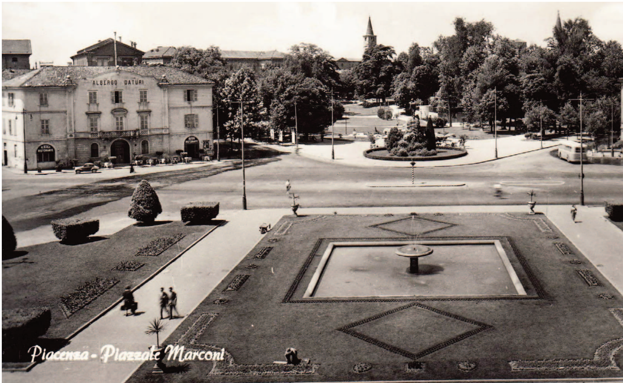
Piacenza - Piazza Marconi