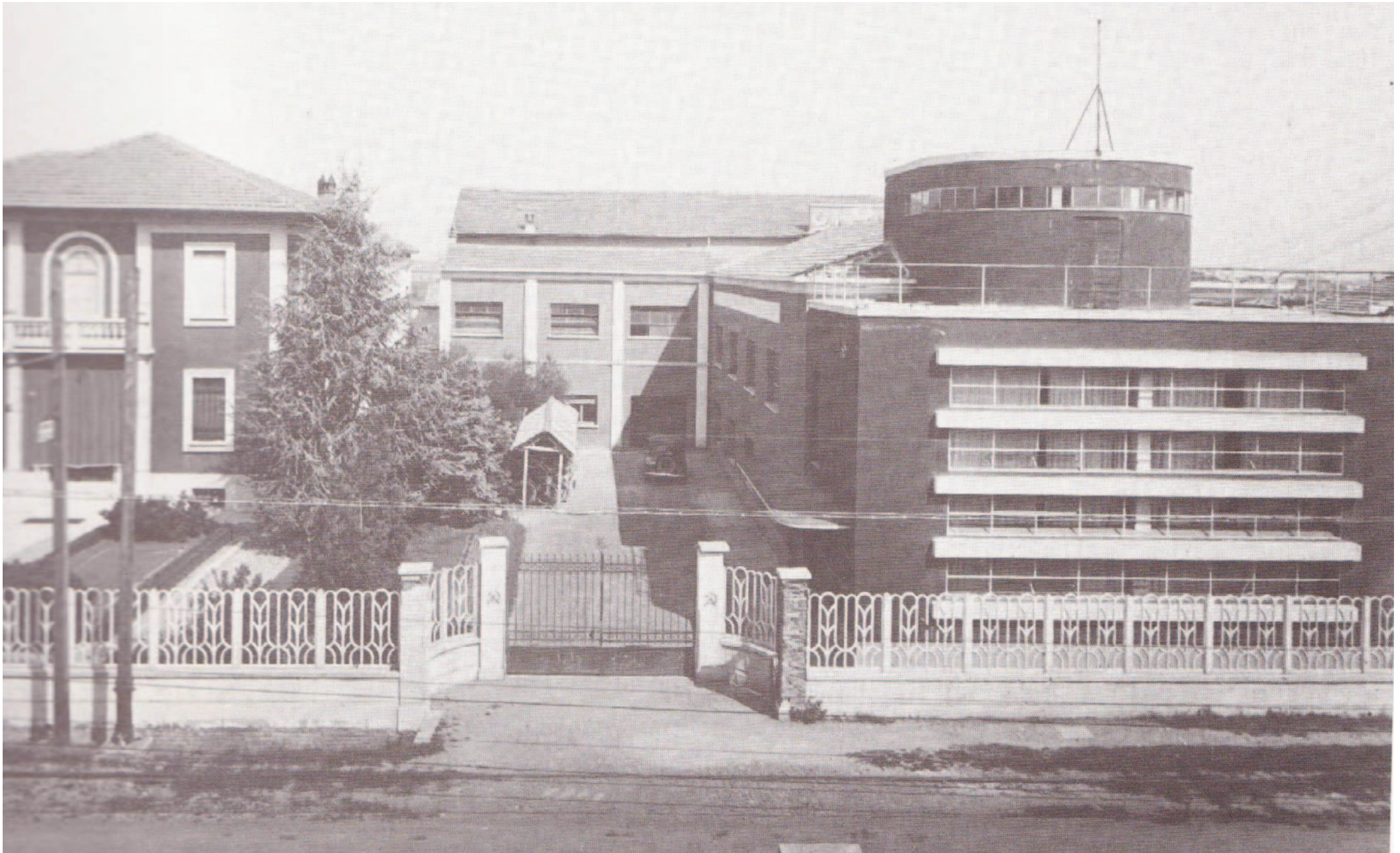
Bottonificio Federici in via Vittorio Veneto (demolito)