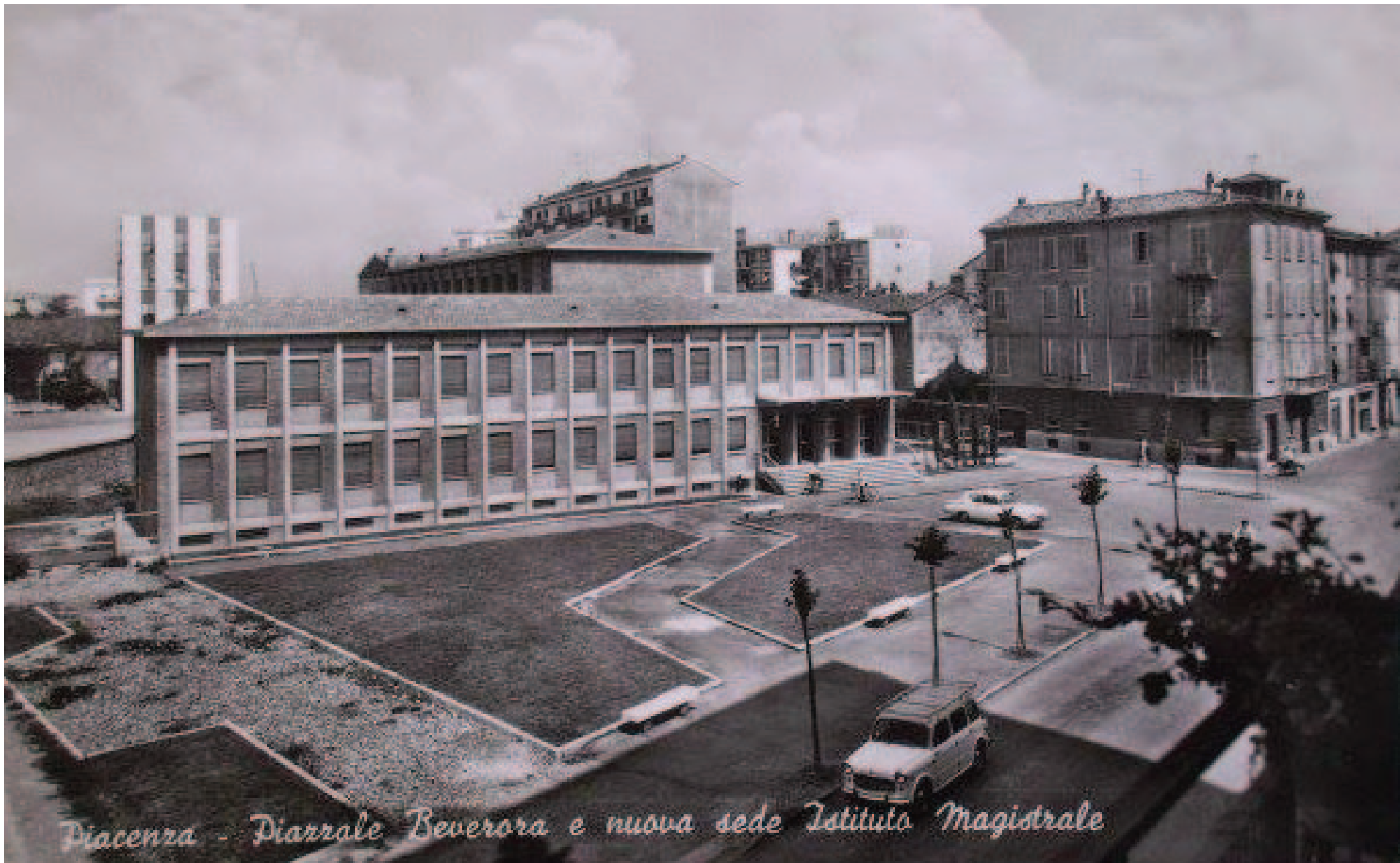
Piacenza - Diarrale Beverora e nuova sede Istituto Magistrale