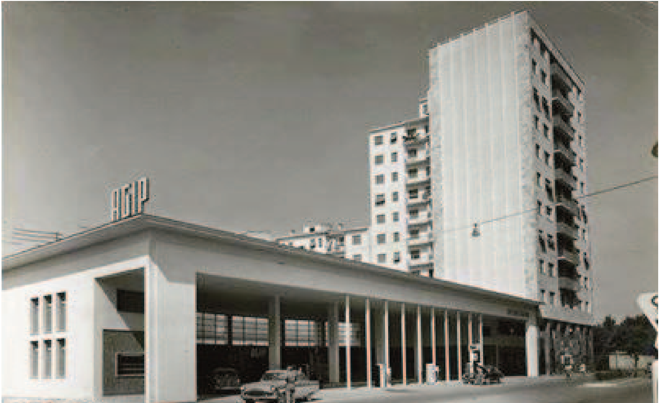
Distributore di benzina di Via Genova, arch. Baciocchi