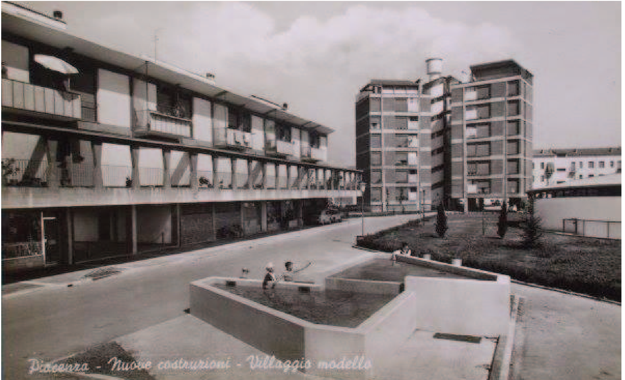
Piacenza - Nuove costruzioni - Villaggio modello