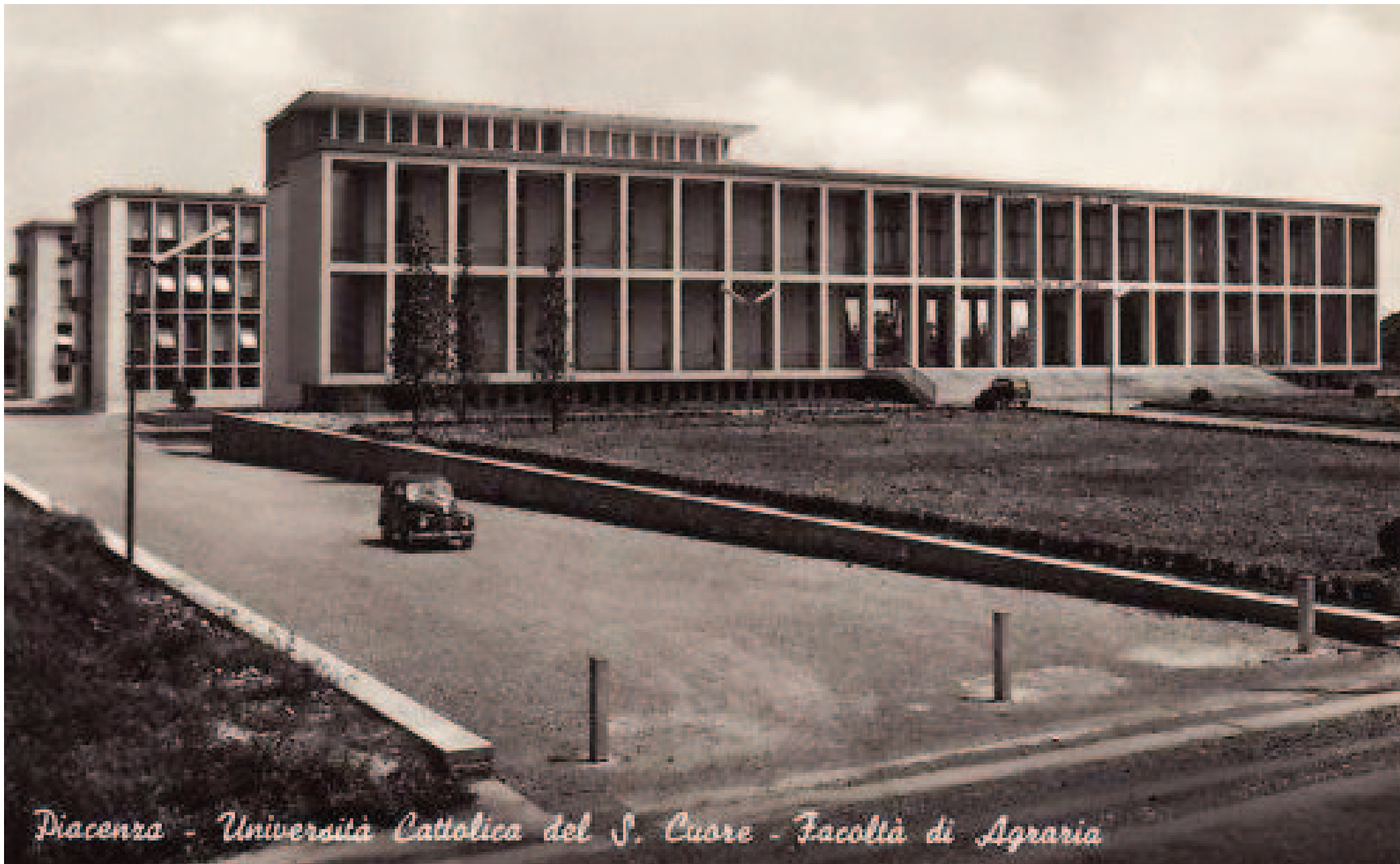
Piacenza - Università Cattolica del S. Cuore - Facoltà di Agraria