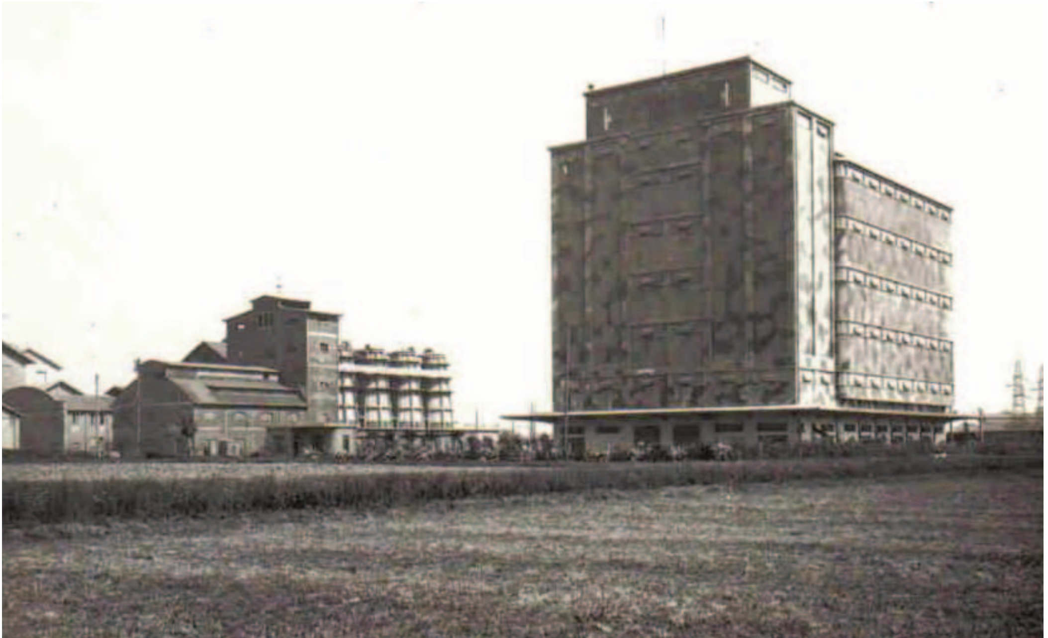
Silos Consorzio Agrario