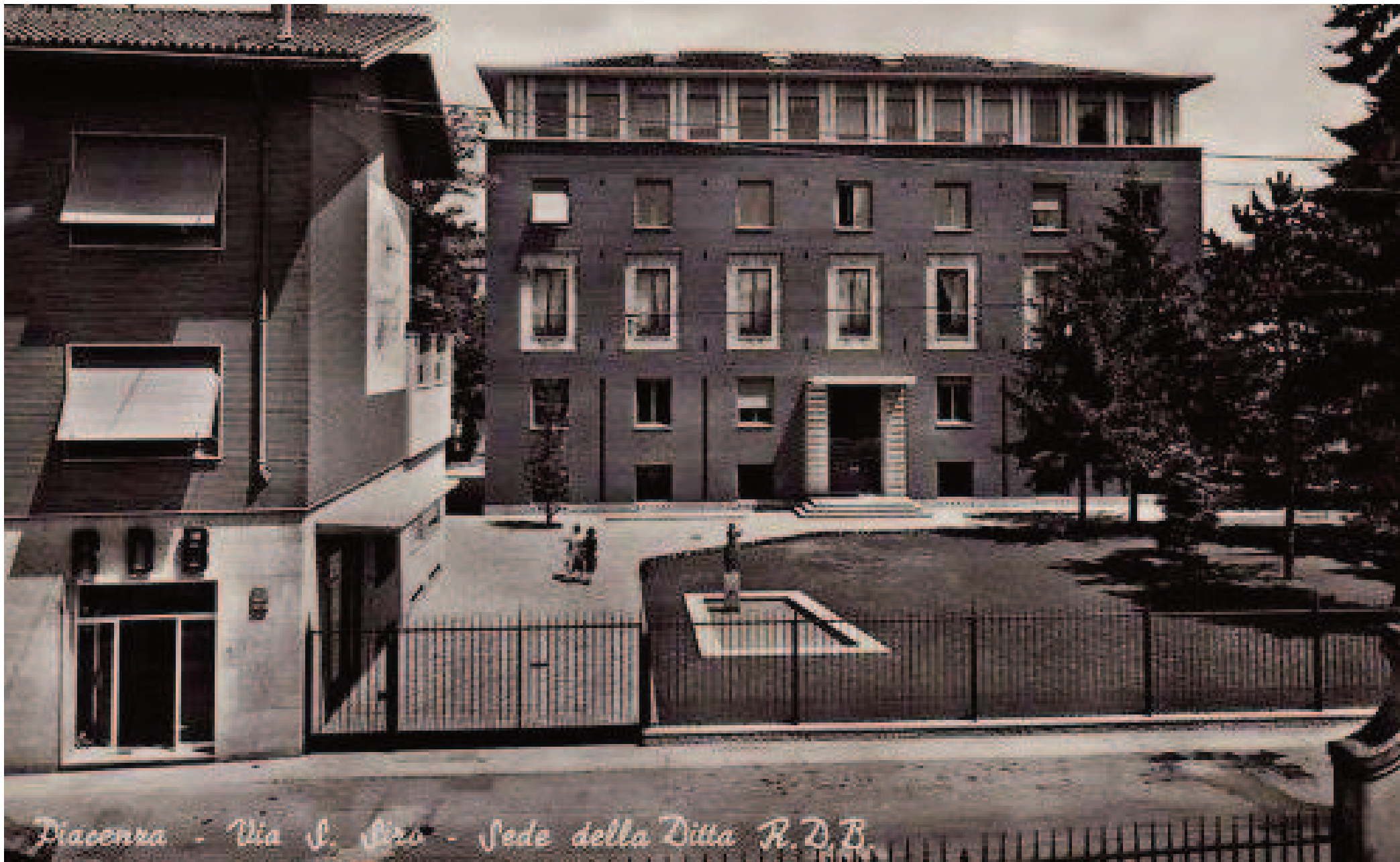
Piacenza - Via S. Siro - Sede della Ditta R.D.B.