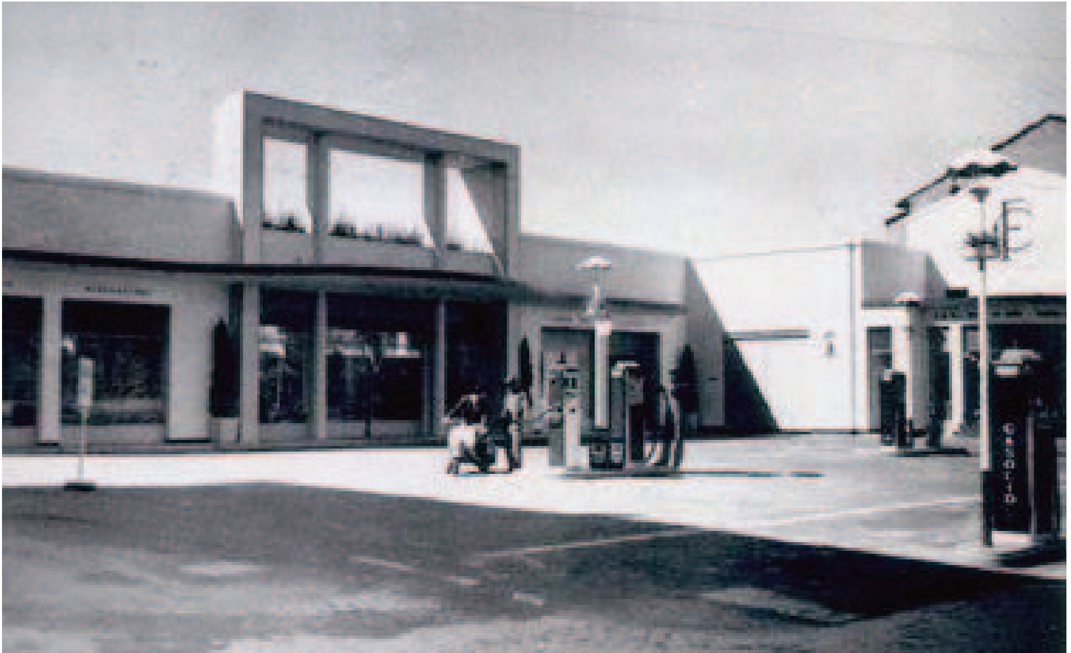
Distributore di benzina di Via Colombo (oggi Kaefu Market) di fronte al Consorzio Agrario